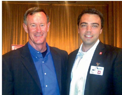
Admiral William McRaven, Kommandant United States Special Operations Command mit dem Autor.

diskussionen (think tanks). Über zwanzig Wochen habe ich wöchentlich einen Newsletter zur Sicherheitspolitik und zu den Streitkräften der USA, genannt Bulletin, verfasst und diesen an Schweizer Militärangehörige und Diplomaten gesendet. Nebst anderer Schreibarbeit durfte ich an einer internationalen Sicherheitskonferenz über den Einfluss der neuen Kommunikationsmittel (Facebook, Twitter etc.)