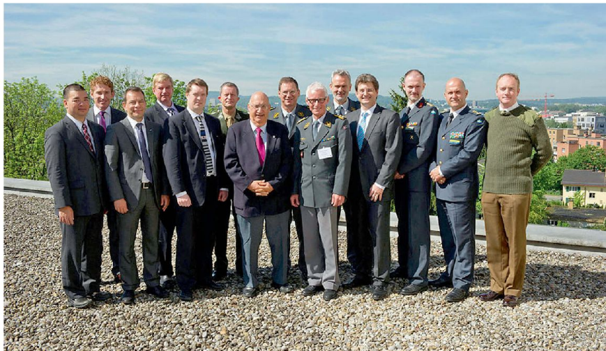
Referenten der Konferenz.

Die Bekämpfung ballistischer Raketen (Ballistic Missiles BM) kann nur im internationalen Verbund erfolgen. Die USA haben unter dem Namen NIMBLE TITAN ein Experiment (Wargame) gestartet, das die Interessen und Möglichkeiten von Staaten aufnimmt und gemeinsame Lösungen sucht. So sollen Sicherheitspolitik, Konzepte sowie Erfahrungen im Verbund festgelegt und konsolidiert werden. Aktuell sind regionale Experimente im Pazifik-Raum und in Europa sowie für die NATO erstellt worden. Die nächste