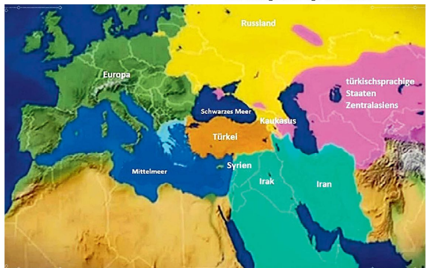
Geostrategische Lage der Türkei.

Die drohende Isolation durch das US-amerikanische Waffenembargo 1975–78 führte der Türkei vor Augen, dass eine eindimensionale Ausrichtung sicherheits- und wirtschaftspolitisch nicht ausreichend sein kann. Damit gewann die Annäherung an neue Partner besonders im arabischen Raum an Bedeutung. Eine Rückbesinnung auf osmanische Einflussphären könnte der Türkei helfen, über gemeinsame Geschichte und Kultur als Anknüpfungspunkte den Aufbau ihrer regionalen Machtposition zu sichern, vielleicht diese sogar zu einer globalen auszubauen.