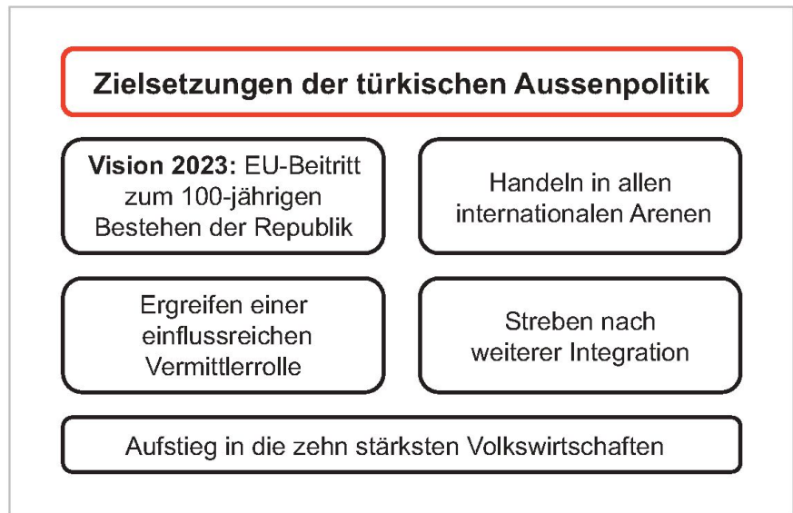
Zielsetzungen der türkischen Aussenpolitik. Grafiken: Autor

Anstatt abseits der Ereignisse zu verweilen, sollte die Türkei jetzt – im positiven Sinne – aggressiv werden, überall präsent sein und ihren Beitrag zu regionalen genauso wie zu globalen Entwicklungen