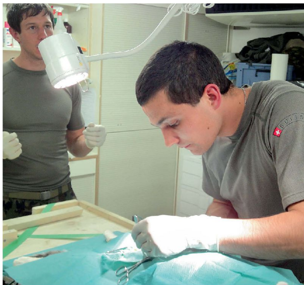
Richtig im Element – operierende Vet Az Of in der mobilen Tierklinik während des militärischen Praktikums.

der Armeetiere. Tierärzte werden in erster Linie im kurativen Bereich (Tierpflege und Tiermedizin), aber auch in der professionellen Bekämpfung von Tierseuchen und dem Betrieb mobiler Tierkliniken eingesetzt. Die hochmobilen, vollständig ausgerüsteten Tierkliniken ermöglichen eine tierärztliche Versorgung der Train- und Hundeführerformationen vor Ort im Einsatzgebiet. Im Bedarfsfall können die Tierkliniken bei Umweltkatastrophen subsidiär zugunsten ziviler Bedürfnisse eingesetzt werden.