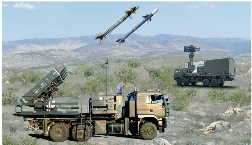
Spyder Short Range System, MFU und CCU.

Bei diesen heftigen Attacken wurden zirka 1400 Flugkörper unterschiedlicher Bauart (z. B. Fadschr-5) Richtung Norden abgefeuert. Etwa 500 davon wurden als zielrelevant eingestuft; die Abschussquote von Iron Dome lag bei 86 %. Die-