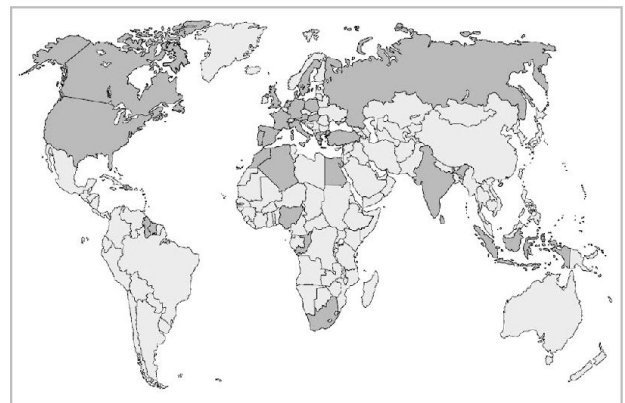
Die dunkel hervorgehobenen Länder und ex-Kolonien zeigen auf, wo Eidgenossen in «Fremden Diensten», vom 15. bis zum 20. Jahrhundert, im Einsatz gewesen sind.

sogenannte «Partikularkapitulationen». Durch diese Art von Verträgen, die in der Eidgenossenschaft zum Teil heftigen Protest auslösen und gegen die in den Tagsatzungen immer wieder Klage geführt wird, entstehen die erblichen Regimenter einzelner Familien.