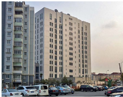
Cyberwar Einheit 61 398 in Shanghai.

In der Schweiz erfolgen nach Auskunft Berner Sicherheitsstellen solche Cyber-