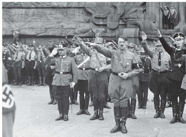
Abb. 2: Hitler erlässt in Leipzig den Befehl, die Deutschen zum Nationalsozialismus zu erziehen (16. 07.1933).

War es eine Art stillschweigender Waffenstillstand der beiden Seiten, um den inneren Zusammenhang des Volkes zu stärken? Jedenfalls begann die Rechte nach dem Krieg, die Erinnerungskultur wieder vermehrt zu nationalsozialistische Deutschland war die Völkerschlacht dann aber bloss zu Beginn und zum Ende von einer gewis-