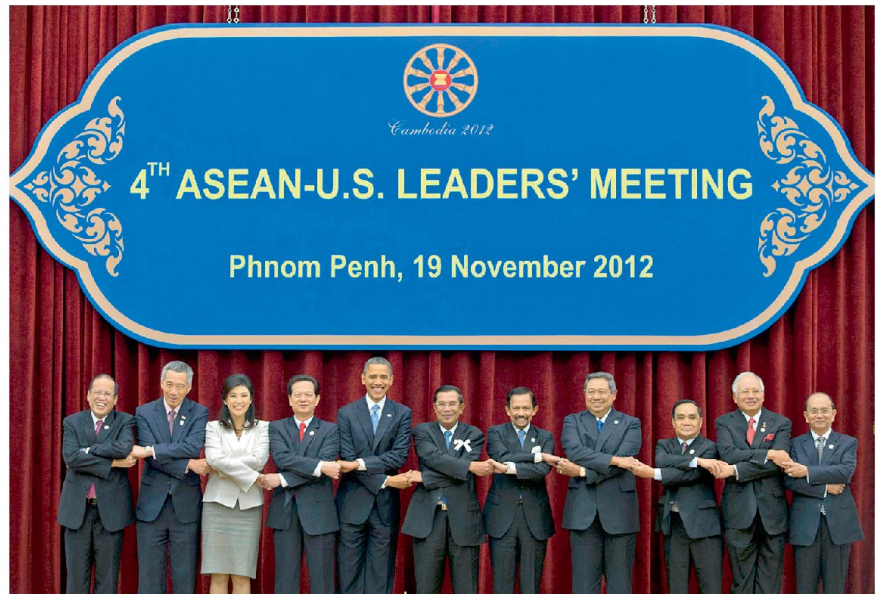
ASEAN – US Leaders' Meeting, Phnom Penh, Nov. 2012.

Es existiert aber noch eine weitere Dimension in Amerikas Rolle im chinesi-