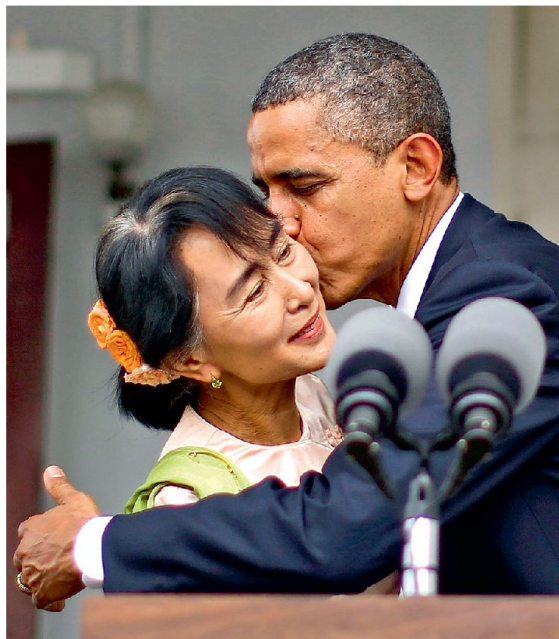
Obama und San Suu Kyi, ASEAN – US Leaders' Meeting.

Aus chinesischer Sicht ist die neue amerikanische Asienstrategie nicht nur gegen China gerichtet, viel schlimmer, sie destabilisiere die Region: 3 Amerikanische