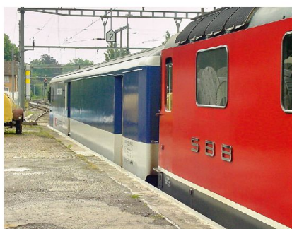
Täglich Bassersdorf–Bern–Bassersdorf: Transporte per «Jail-Transport-System».

Bis vor einigen Jahren waren derartige Transporte von Häftlingen eine Aufgabe der verschiedenen Polizeikörpers, oft in Einzelfahrt, wenn nötig durch die ganze Schweiz. Pro Fahrzeug wurden immer zwei Polizistinnen und Polizisten benötigt. Die stetig zunehmenden Transportbedürfnisse veranlassten die KKJPD eine neue Lösung zu suchen. Im Jahr 2000 begann das Outsourcing an die ARGE Securitas/SBB, die heute die meisten dieser Transporte sicherstellt.