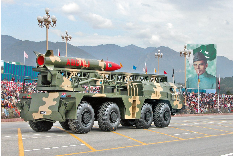
Pakistanische Abdali I Kurzstreckenrakete. Im Hintergrund ein Porträt des Staatsgründers Jinnah.

halten wollte. Pakistan leitete aus der muslimischen Bevölkerungsmehrheit Kaschmirs seinen Anspruch auf das Gebiet ab und mobilisierte Freischärler, die im Kaschmirland einfielen. Um militärische Unterstützung von Indien zu erhalten, erklärte der Maharaja den Anschluss Kaschmirs an die Indische Union. Beide Staaten verlegten in der Folge Truppenkontingente in die umstrittene Region. Der erste indisch-pakistanische Krieg noch im Unabhängigkeitsjahr endete mit der De facto-Zweiteilung Kaschmirs unter Vermittlung der Vereinten Nationen. Die Grenzlinie zwischen dem pakistanisch und dem indisch verwalteten Teil bildet die Waffenstillstandslinie (Line of Control) von 1949. Pakistan provozierte 1965 und 1999 erneute militärische Konfrontationen, die jedoch zu keiner Veränderung am Status quo führten. 1972 unterzeichneten die Ministerpräsidenten der beiden Staaten das Shimla-Abkommen, das die Regelung der Kaschmirfrage durch bilaterale Verhandlungen und die Akzeptierung der Waffenstillstandslinie als vorläufige Staatsgrenze vorsah. Aus pakistanischer Optik stellt die UN-Militärbeobachtermission UNMOGIP 1 , an der sich seit 2013 auch die Schweiz beteiligt, ein transitorisches Instrument dar, um die Kaschmirfrage im multilateralen Rahmen zu thematisieren. New Delhi hingegen interpretiert das Shimla-Abkommen als Anerkennung der Staatsgrenze, das Indien zwei Drittel des Territoriums Kaschmirs zugesteht und betrachtet die UNMOGIP als obsolet.