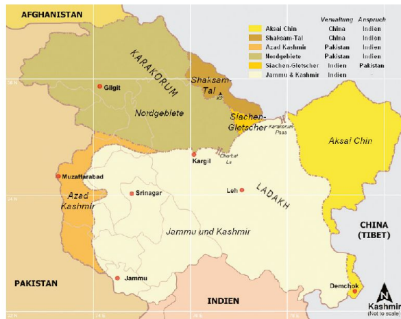
Territoriale Ansprüche im Kaschmir.

Am Ursprung des Kaschmirkonflikts stehen die Bildung der Indischen Union aus den hinduistisch dominierten Gebieten Britisch-Indiens und die Errichtung Pakistans aus den Regionen mit muslimischer Bevölkerungsmehrheit. Die Herrscher der halbautonomen Fürstenstaaten konnten wählen, welchem Nachfolgestaat sie beitreten wollten. Kaschmir blieb nach der Partition zunächst unabhängig, da der lokale Fürst, ein Sikh-Maharaja, die Souveränität seines Fürstenstaats aufrechter-