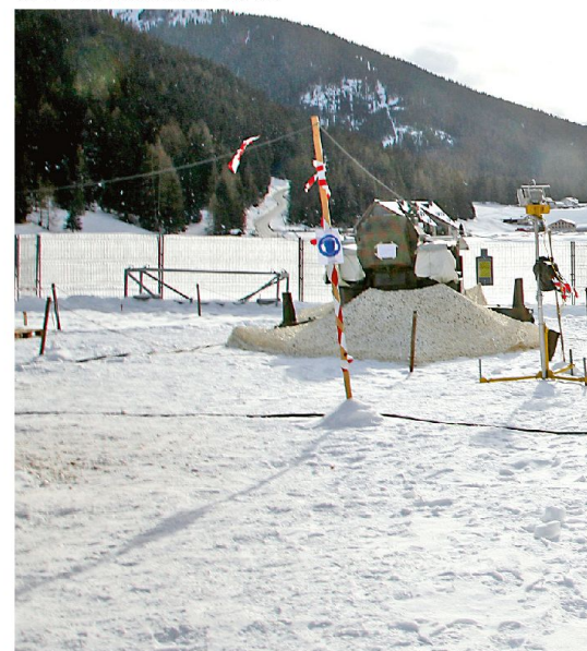
35 mm Feereinheit im Einsatz anlässlich WEF 2014 im Raum Davos.

Am 6. Januar 1964 begann auf dem Waffenplatz Emmen mit dem Schulkom-