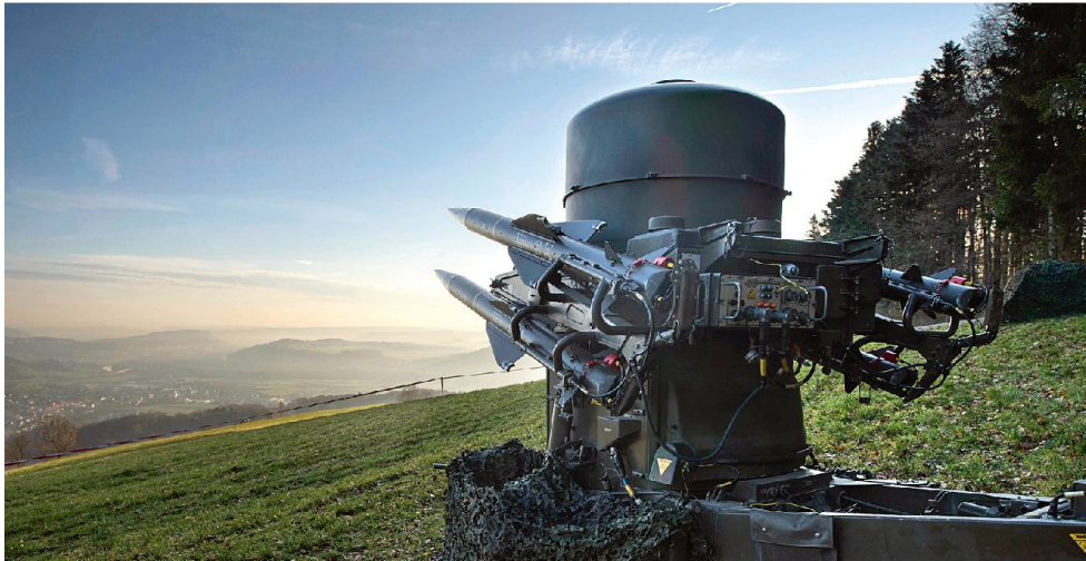
Mob Flab Lwf Rapier an der Volltruppenübung CHESS DUO 2014 (RAPIER + STINGER).