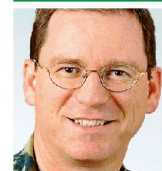
Brigadier Marcel Amstutz Kdt LVb Flab 33 3626 Hünibach BE

Know-how und Herzblut sind auch für BODLUV 2020 kritische Erfolgsfaktoren. Lernen wir aus der Erfahrung. ■