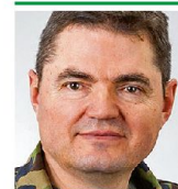
Brigadier Hans Schatzmann lic. iur. Kdt Infanteriebrigade 5 3380 Wangen an der Aare

tritt der Panzerbataillone 28 und 29 aus deren Angriffgrundstellungen zu ermöglichen, wurden vom Kommandanten des Einsatzverbandes gemäss An-