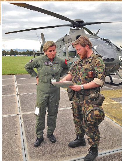
Absprache der Flugroute zwischen Art Schiesskommandant und Heli-Pilotin der LW

tritt der Panzerbataillone 28 und 29 aus deren Angriffgrundstellungen zu ermöglichen, wurden vom Kommandanten des Einsatzverbandes gemäss An-