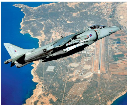
Abb. 3: RAF Harrier über der Akrotiri Air Base.

dem sich die meisten Flüchtlinge in den von den Türkisch-Zyprern im Süden verlassenen Dörfern längst eingerichtet haben. Die aktuelle Finanzkrise, die mit Ausnahme der Banken Zypern noch nicht richtig erfasst hat, dürfte diese Einstellung nur noch verfestigen. Aus diesen Gründen