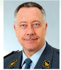
Geschätzte ASMZ-Leserinnen und Leser

Ende März durfte ich 23 junge Kameraden ins Korps der Generalstabsoffiziere aufnehmen. Die frisch brevetierten Offiziere sind ca. 1980 geboren. Also noch mitten im Kalten Krieg. Unsere Armee verfügte damals über einen Effektivbestand von 800 000 Soldaten, 260 Kampfflugzeugen und 800 Artilleriegeschütze. Als die Kameraden dann in die Primarschule kamen, fiel die Berliner Mauer und kurze Zeit später ging die Sowjetunion unter. 1991 prallten in der irakischen Wüste über eine Million Soldaten in einem konventionellen Krieg aufeinander. In den Jahren 1999 bis 2001 traten die Junioren dann in die Rekrutenschule ein. Von der Intervention im Kosovo bis zu 9/11 hat sich in diesen drei Jahren viel verändert. In der Schweiz befanden wir uns derweil im Umbruch zwischen der «Armee 95» und der «Armee XXI». In mehreren Schritten reduzierten wir die Bestände auf 450 000, 380 000 und schlussendlich 200 000 Armeeinghörige. Aus der Dissuasion wurde «Sicherheit durch Kooperation». Währenddessen sammelten unsere jungen Kameraden Erfahrungen als Kompaniekommandanten und nahmen die Laufbahn als Generalstabsanwärter in Angriff. Mit der WEA reduzieren wir den Bestand weiter auf noch 100 000 Armeeinghörige und wir werden – sofern der Gripen beschafft werden kann – künftig noch 54 Kampfflugzeuge haben. Und jetzt? Nach der Intervention auf der Krim spricht die ganze Welt plötzlich wieder von alten, bekannten Mustern. Zwei Erkenntnisse sind wichtig: