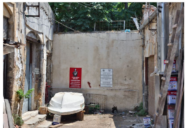
Abb. 2: Grenze durch Nikosia.

Seit den 70er Jahren treffen sich Präsidenten/Vertreter des Südens mit solchen des Nordens – wie man scherzhaft zu sagen pflegt – zum Kaffeekränzchen, ohne dass dabei die heissen Eisen wie etwa Eigentumsfragen wirklich angegangen würden. Bedenkt man, dass die junge grie-