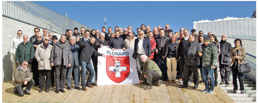
Jubiläum zehn Jahre FLORAKO vom 16. März 2014, ehemalige und aktive FLORAKO Mitarbeiterinnen und Mitarbeiter.

Vor genau zehn Jahren wurde das neue FLORAKO von der Luftwaffe in Betrieb genommen. Die offizielle Übergabe an die Benutzer fand am 17. März 2004 statt. Das äusserst komplexe FLORAKO System wurde während acht Jahren evaluiert. Die Arbeiten begannen 1992 und erreichten im Jahr 1998 die Beschaffungsreife. 1998, 1999 und 2004 wurden die Beschaffungsbotschaften den eidgenössischen Räten vorgelegt. Dazu gehörten speziell für die Schweiz entwickelte detaillierte Spezifikationen. Die Projektleitung unter der Führung der armasuisse setzte sich weiter aus Vertretern der Luftwaffe, des Planungsstabes, der RUAG, der Skyguide und weiteren Bundesstellen zusammen. Nach den Kreditbewilligungen wurde das System entsprechend den durch unsere Fachleute ausgearbeiteten Spezifikationen für unser Land gebaut. Damit verfügte die Schweiz bei der Inbetriebnahme über das wirklich modernste System. Zusammen mit den notwendigen Bauten umfasste das Budget etwa 1 Mia CHF. Beteiligte Fir-