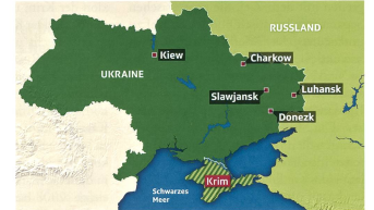
Die Brennpunkte.

5. Der Konflikt eskaliert – ohne direkte Intervention Russlands: Die prorussischen Separatisten erhalten aus Russland wei-