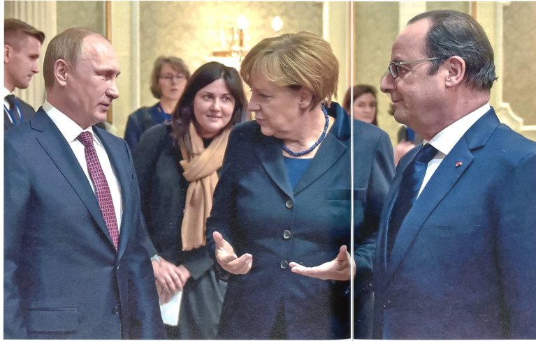
Während den Verhandlungen zu Minsk II; Putin, Merkel, Hollande.