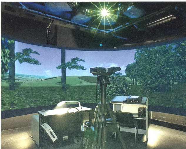
ELSA SKdt: Arbeitsplätze des mot SKdt Trupps.