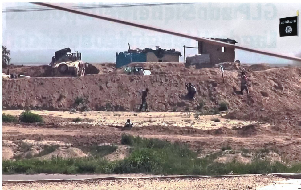
Operation des IS bei Kirkuk (liveleak, aus einem Propagandafilm des IS).

Die IS-Propaganda verspricht den Neuankömmlingen, unter ihnen ganze Familien aus dem Westen, ein islamisches Utopia, das funktionierende staatliche Strukturen, Wohlstand mit einer konservativ-islamischen Lebensführung des 7. Jahrhunderts vereint. Tatsächlich ist es dem IS gelungen, durch die Bekämpfung der ärgsten Korruption und die Bereitstellung staatlicher Dienstleistungen unter der sunnitischen Bevölkerung eine gewisse Un-