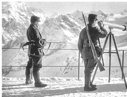
Schildwache auf der Dreisprachenspitze.

Eindrückliche Spuren damals beteiligter Gebirgssoldaten aller drei Nationen finden sich noch heute im Gebiet des Stilsferjochs bzw. des Pass Umbrail. Die Ereignisse entlang der höchstgelegenen Frontlinie des Ersten Weltkrieges sind gut dokumentiert. Das Stellungssystem zwischen der Dreisprachenspitze und dem Piz Umbrail wurde durch den Archäologischen Dienst des Kantons Graubünden inventarisiert; als wohl jüngstes, archäologisches Bodendenkmal Schweizerischer Militärgeschichte. Drei Themenwege vermitteln detaillierte Informationen und im «Museum 14/18» in Sta. Maria Val Müstair findet der militärhistorisch interessierte Besucher Bilddokumente von einmaliger Qualität. Im August dieses Jahres werden die Umbrailstellungen schweiz-