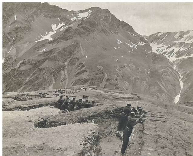
Angehörige des Infanteriebataillons 76 exerzieren den Bezug der Stellungen, Juni 1915.

«1. Die Besetzung des Münstertales (einschliesslich der an die Grenze vorgeschobenen Einheiten und Postierungen) ist auf ein Bataillon zu erhöhen;