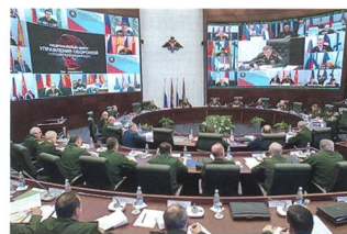
Befehlsausgabe anlässlich einer Überprüfung der Kampfbereitschaft der russischen Streitkräfte im März 2015.

klar, dass es dabei nicht nur um den Ausbau und die Erneuerung des gesamten Arsenal geht, sondern auch um eine verstärkte Ausbildung der Ka-