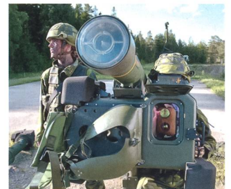
Die nachladbare RBS-70NG kurz vor dem Abschuss.

Die Litauischen Streitkräfte erhielten per Juni 2015 eine erste Lieferung der modernisierten Luftabwehrrakete der vierten Generation, RBS-70 NG VSHORAD. Somit steht dem litauischen Luftabwehr Bataillon nebst acht Einheiten Dual-Mount Stinger (inkl. Sentinel Radar), 18 Bofors 40 mm Kanonen und etwa 20 RBS-70 Mk1 Systemen neuer-