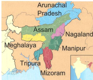
Karte des östlichen Indiens.

Viele kritisierten das Fehlen einer umfassenden Strategie