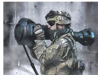
NLaw beim Abschuss.

Mit der NLaw verfügt ein Soldat über die Möglichkeit, jedes gepanzerte Fahrzeug zu neutralisieren. Die rückstossfreie, schultergestützte Panzerabwehrwaffe kann ein Ziel von oben herab bekämpfen, was insbesondere den Einsatz in überbautem Gelände erlaubt. Die 12,5 kg schwere Waffe verfügt über eine Reichweite von 20–600+ Metern, ist wartungsfrei und unter allen Klimabedingungen einsetzbar. Mit einer Lebenser-