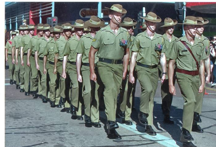
Ausbildung in der australischen Armee.

Die Schulbildung gehört zu den wichtigsten Erkennungsmerkmalen für potenzielle Abbrecher. Soldaten, die eine geringe Schulbildung aufweisen, kommen meist mit einer höheren, aber de facto unrealistischen Erwartungshaltung zu den Streitkräften. Dies liegt unter anderem auch da-