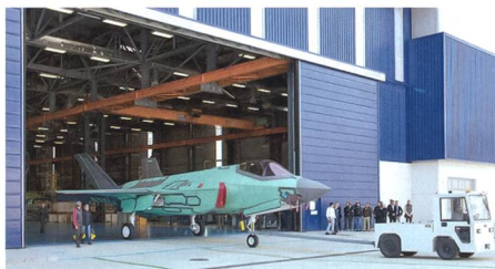
Erster F-35 beim Rollout in Italien.

Italien wird bis ins Jahr 2020 nur 35 Stück des Kampfflugzeugs Typ Lockheed-Martin F-35 «Lightning II» beschaffen. Vor sechs Jahren noch wurde beabsichtigt, die Aeronautica Militare mit 131 F-35 auszurüsten. Seither wurden im Zuge von Kostenerhöhungen die Zahlen auf 90 Stück, und letzt-