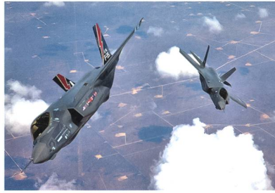
Der Joint Strike Fighter F-35.

Nach den ersten Erkenntnissen aus dem Manöver sind zumindest die technischen Probleme behoben. Auch das Handling stelle keine zusätzlichen Schwierigkeiten dar. Piloten und Bodenpersonal loben den Manövereinsatz der Flugma-