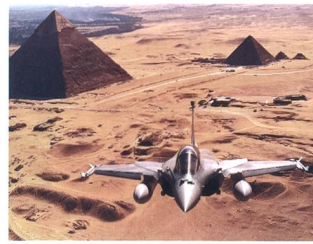
Rafale über Gizeh.

der Suche nach einem zusätzlichen (russischen) Flugzeug ist, in der Typenauswahl zwischen MiG-35 und MiG-29 für das letztere entschieden. Diese Ankündigung kommt nur kurz nachdem bereits im Februar dieses Jahres eine Vereinbarung mit Frankreich getroffen wurde, 24 Dassault Rafale Kampffjets für ca. 5,2 Milliarden EURO zu erwerben. Begründet werden beide Käufe