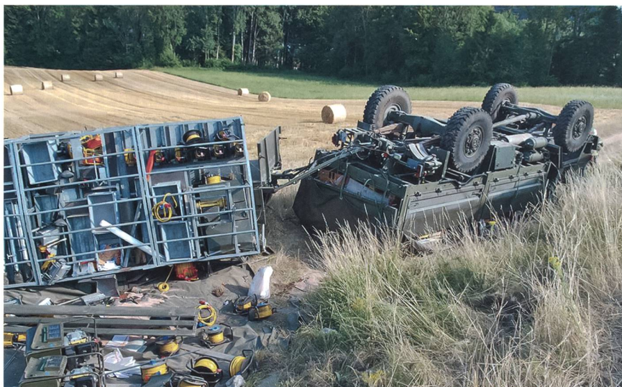
Häufigste und kostenintensivste Schäden: Unfälle mit Bundesfahrzeugen.

Eine weitere Ausnahme betrifft die militärischen Flugobjekte: Es werden nur die sogenannten Drittschäden über das Schadenzentrum VBS abgewickelt. Am Beispiel des Absturzes einer F/A-18 vom 23. Oktober 2013 im Raum Alpnach mussten einzig die Schäden am Boden übernommen und ausgewiesen werden. Es ging dort hauptsächlich um Beschädigungen an Strassen, Eisenbahn, Fussgän-