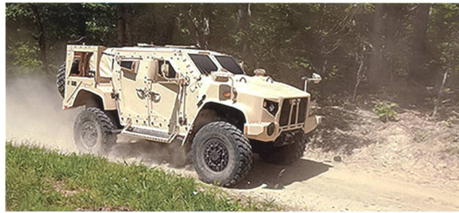
Neues Geländefahrzeug auf Testfahrt.

Das Auftragsvolumen beläuft sich zunächst auf 6,75 Milliarden Dollar. Insgesamt sollen allerdings aber über 30 Milliarden Dollar von Seiten des US-Militärs in die neuen Fahrzeuge investiert werden.