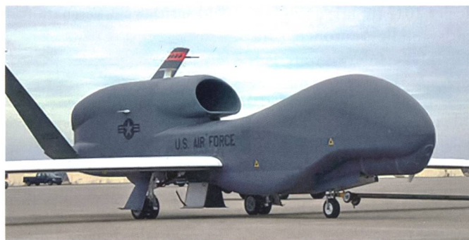
Die Drohne Global Hawk.

Insgesamt hat sich die Zahl der Drohneneinsätze der US-Streitkräfte innerhalb der letzten zehn Jahre rapide erhöht. 2004 waren es laut Wall Street Journal noch fünf Flüge pro Tag. Offizielle Angaben, wie viele Menschen bei US-Drohneneinsätzen getötet worden sind, gibt es nicht. Die britische Journalisten-Initiative Bureau of Investigative Journalism zählt in ihrem jüngsten Bericht seit Juni 2004 allein für Pakistan 419 Einsätze, dazu eine Zahl von Todesopfern, die zwischen 2467 und 3976 Menschen liegen könnte.