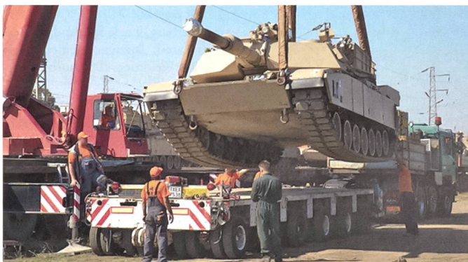
Von der Bahn in Bulgarien auf den Tieflader.