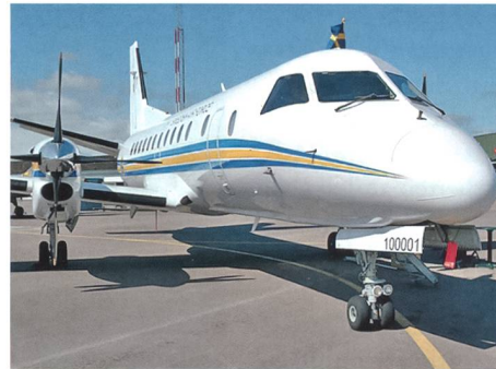
Schwedischer SAAB TP 100A Open Skies modifiziert.

Die Schwedische Luftwaffe führte bis Ende August wiederum Aufklärungsflüge über