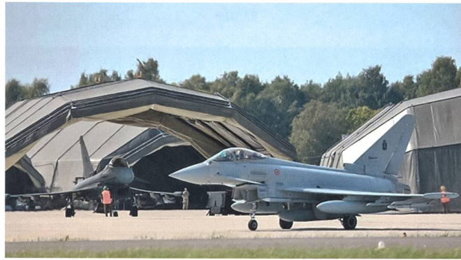
Italienischer Eurofighter vor dem letzten Start in Šiauliai.

Sinne der Allianz für diejenigen Länder einzustehen, welche über keine eigenen Luftpolizeikapazitäten verfügen. Nachdem sich die Aeronautica Militare nun aus dem Baltikum zurückgezogen hat, darf sie sich die einzige an allen «Interim Air Policing»-Missionen beteiligte Luftwaffe der NATO rühmen. Konkret standen die Italiener seit 2004 über Slowenien, Albanien, Island und nun auch dem Baltikum im Luftpolizeidienst. Für die Baltic Air Policing-Mission standen per 1. September weitere Veränderungen an, nunmehr steht sie mit nur acht Flugzeugen im Einsatz. Mit der Reduktion um die Hälfte