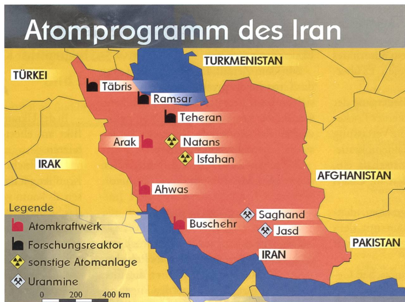
Atomprogramm des Iran.

US-Präsident Obama nannte den Atom-Deal einen «historischen Durchbruch», denn nun wird Teheran mindestens zwölf Monate benötigen, um ausreichend atomwaffenfähiges Uran produzieren zu können. Das Juli-Abkommen basiert auf dem Genfer Aktionsplan vom November 2013 und dem im April 2015 in Lausanne unterschriebenen Rahmen-