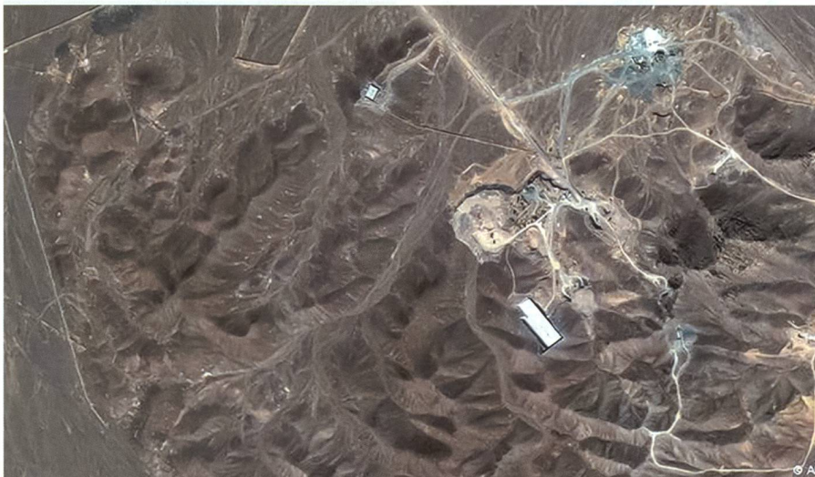
Satellitenfoto von 2012 der verdächtigen Atomanlage Fordo (zwischen Teheran und Natans).

plan. Während Präsident Rohani versprach, «freiwillige Massnahmen» zu ergreifen, macht die Verabschiedung der UN-Resolution 2231 kurz danach die Vereinbarung rechtsverbindlich. Der Vertrag trat am 19. Oktober, dem «adoption day», in Kraft. Erst nach der Erfüllung diverser Auflagen kann Teheran Anfang 2016 mit der Aufhebung von verschiedenen Sanktionen rechnen. Man spricht von dem sogenannten «implementation day», an welchem automatisch sieben UN-Resolutionen (erlassen zwischen 2006 und 2013) aufgehoben werden. Doch gleichzeitig bleiben die Embargos das schärfste Schwert der Weltgemeinschaft. Als diplomatische Meisterleistung gilt in diesem Zusammenhang das sogenannte «Snapback-Verfahren». Danach kann jedes ständige Mitglied des UN-Sicherheitsrats im Falle von Vertragsbruch die Iran-Sanktionen allein wieder in Kraft setzen. Diese wirtschaftlichen Druckmittel bremsen die Entwicklung des Landes über Jahre massgeblich. Nach neun Jahren Sanktionen liegt die Wirtschaft am Boden und die Infrastruktur bedarf dringend einer Modernisierung. Ein Eldorado auch für deutsche Firmen. Doch nicht alle Sanktionen fallen sofort. Erst nachdem die Internationale Atomenergiebehörde (IAEA) die Konformität Irans mit den verhandelten Auflagen bestätigt, erfolgt eine schrittweise Aufhebung ab Anfang des Jahres 2016. Das Waffenembargo sowie die Massnahmen gegen ein Raketenprogramm bleiben weitere fünf bzw. acht Jahre in Kraft.