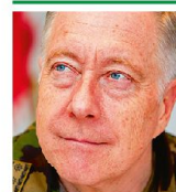
KKdt André Blattmann Chef der Armee 3003 Bern

* Gekürzte und leicht angepasste Fassung des Beitrages CdA im Blog der Generalstabsoffiziere von Dezember 2014.