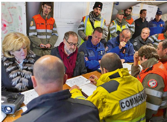
Übung «SANDY»: Koordinationsrapport.

von Jongny.