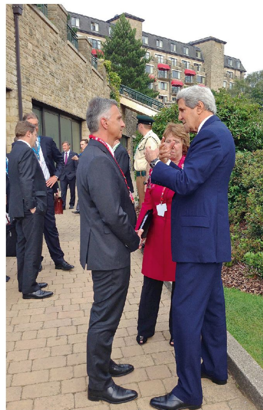
Treffen mit John Kerry (USA) und Catherine Ashton (EU) beim Gipfeltreffen der NATO in Newport (Wales) am 5. September 2014.

Die Ukrainekrise hat aufgezeigt, dass grundsätzliche Annahmen zur europä-