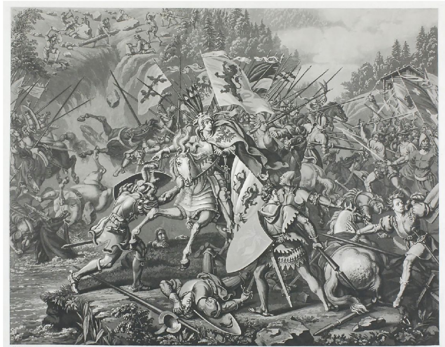
Schlacht von Morgarten.

Im Kontrast zum an unbekanntem Ort ausgestellten Bundesbrief von 1291 musste man sich nun nicht mehr verstecken, man hatte weniger Angst. Der in Brunnen keinen Monat nach der Morgartenschlacht geschlossene Bund vom 9. Dezember 1315 nennt zum ersten Mal das Wort «Eitgenoze». Der in seiner Zurück-