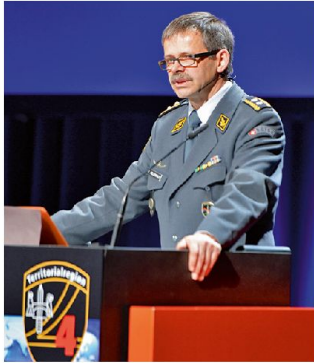
Der Kdt Ter Reg 4 am Jahresrapport in St. Gallen.

Der Kommandant der Territorialregion 4, Divisionär Hans-Peter Kellerhals, blickte am Jahresrapport vor rund 800 Offizieren, höheren Un-