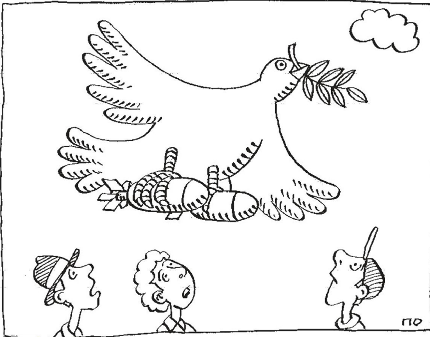
«Demokratisatoren» (Bezeichnung der US-Bomber in Russland).

rekt vor den Toren Russlands. Die NATO ist ein Verteidigungsbündnis mit einem jährlichen Militärbudget von insgesamt 1000 Milliarden USD. Russland hingegen hat eines von 50 Milliarden, also ein 20-mal kleineres. Deshalb ist es kaum nachvollziehbar, dass die NATO-Mitglieder ihre Militärbudgets ausschliesslich wegen der von Russland ausgehenden Gefahr erhöhen wollen.