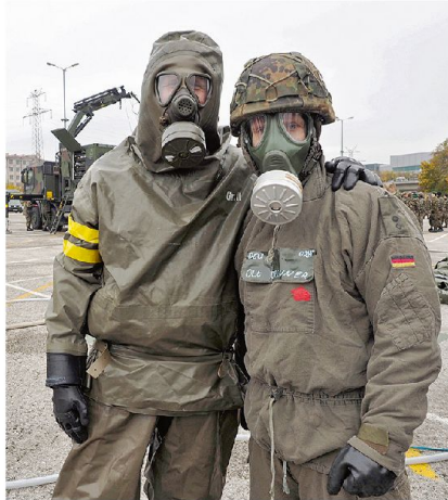
Gelebte Kameradschaft – Schweizer und Deutscher ABC-Abwehrspezialist im Einsatz.

dern dass die vom Fahrzeug gemessenen Werte via Satellitenverbindung nach zehn Sekunden im TOC Spiez auf der Lagekarte verfolgt und ausgewertet werden konnten. Dadurch wurde die elektronische La-