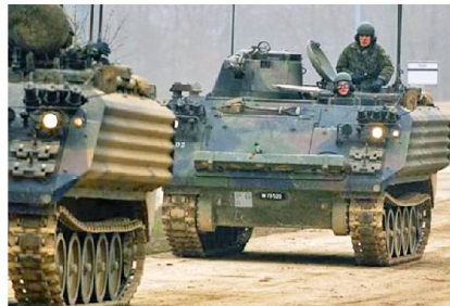
Veraltete Waffensysteme müssen regelmässig erneuert werden.

Zustand sich die eigenen Verbände befinden, ist auf allen Ebenen eine unabdingbare Voraussetzung, um die verfügbaren und angemessenen Mittel wählen zu können. Nur mit diesem Wissen kann jeder Stab und jede Einheit über eine stets aktuelle und einheitliche Gesamtsicht über den Rahmen verfügen, in dem sich der Einsatz abspielt oder abspielen wird. Den