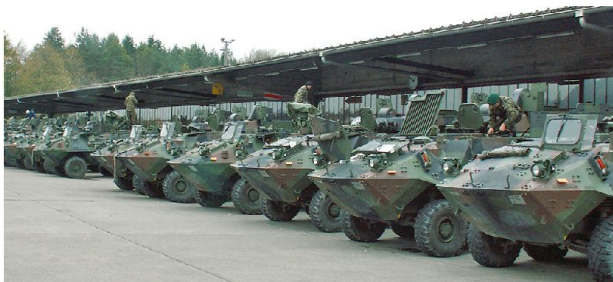
Die ganze Armee muss motorisiert werden, um die geforderte Flexibilität zu erreichen.

Der Wille der Bürger ist nötig, damit unser Milizsystem lebendig bleibt und funktionieren kann. Er drückt sich in der verantwortungsvollen Erfüllung der Dienstpflichten aus und setzt insbesondere auch den spürbaren Abbau von «Ersatzdienstern» (das heisst des Zivildienstes) voraus, für den sich zu viele junge Männer mehr aus persönlicher Annehmlichkeit als wegen Gewissenskonflikten entscheiden. Auch müssen unsere Gesellschaft und unsere Wirtschaft bereit sein, die erforderlichen Kader für diese Milizarmee in genü-