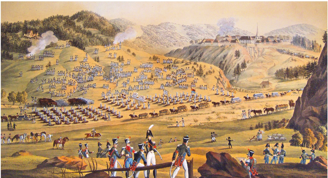
Eidgenössische Truppen im Besammlungsraum Jougne (F), nördlich von Vallorbe.