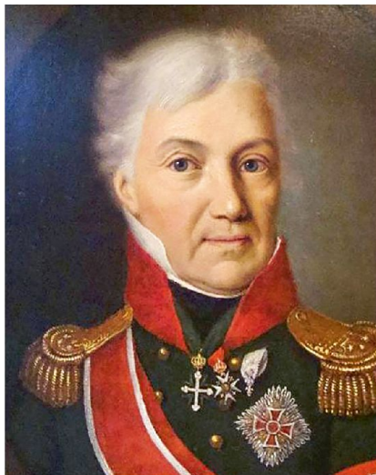
Bachmann in der Uniform eines Schweizer Generals.

ernannte nach längeren Beratungen und politischen Querelen den 75-jährigen Glarner Niklaus Franz von Bachmann zum Oberbefehlshaber der Eidgenössischen Armee. Der Näfelser war somit der erste schweizerische Oberbefehlshaber, der