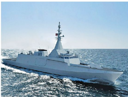
Modell des Second Generation Patrol Vessel der malaysischen Marine; von DCNS Frankreich entwickelt.

Auch die malaysische Marine ist vor Ort präsent und auch sie macht eine Modernisierung durch. Vor allem durch den Kauf von europäischen Schiffen erhofft sie sich eine schnelle technologische Aufrüstung im Vergleich zu den Nachbarländern – und Kontrahenten. Die malaysische Marine ist sehr erfahren in internationalen Einsätzen. So wurde sie beispielsweise in den multinationalen Operationen «Enduring Freedom» (am Horn von Afrika) und «Dawn 9» (am Golf von Aden) eingesetzt. Auch alleine verfügt sie über grosse Erfahrung in Kleinoperationen, beispielsweise in der Antipiraterie-Daueraufgabe in der Strasse von Malakka.