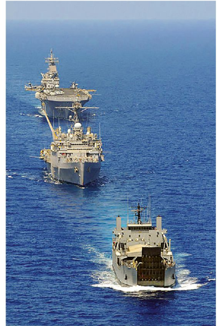
Philippinisch-US-Übung im südchinesischen Meer. Von vorne nach hinten: BRP Dagupan City; USS Denver; USS Essex.

Es handelt sich also nicht nur um die Wiederherstellung der Reichsausdehnung im 19. Jahrhundert. Es geht um die Realisierung des Prinzips, das überall dort, wo China aktiv ist, auch chinesische Inte-