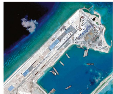
«Fiery Cross Reef» im August 2014 (oben) und im April 2015.

Zuvor hatte China bereits am Johnson South Reef, am Cuateron Reef und am Gaven Reef Inseln aufgeschüttet.