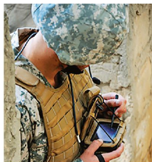
Der Soldat in der Cloud.

Um unter solchen Bedingungen eine Netzwerkstruktur aufzubauen, sind leichte und