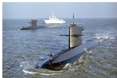
Aktuelle niederländische U-Boote der Walrus-Klasse.

te des ThyssenKrupp-Konzerns übernahm, verfügt über Know-how und Technologie für Design und Produktion