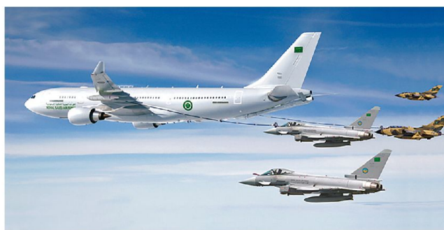
A330 MRTT bei Doppelbetankung.

MRTT steht dabei für Multi Role Tanker Transport (dt. Mehrzweck-Tanker-Transporter).