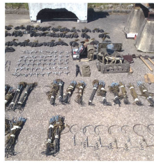
Nach der Inspektion ist vor der WEMA. Das Material wird direkt auf Platz überprüft, gereinigt und für die Abgabe bereitgestellt.

Blick auf das Mikrodispositiv einer Richtstrahlkompanie (Platzbedarf: zirka zwei Fussballfelder pro Kp).