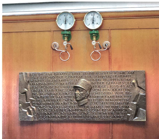
Gedenktafel auf dem DS «Stadt Luzern».

Der politische Grund war die Wahl Walther Stampflis in den Bundesrat am 18. Juli 1940. Hier gab das Parlament dem kranken Hermann Obrecht einen würdigen Nachfolger. Der amerikanische Gesandte Leland Harrison begrüsst die Wahl: «... very well liked, is considered staunchly