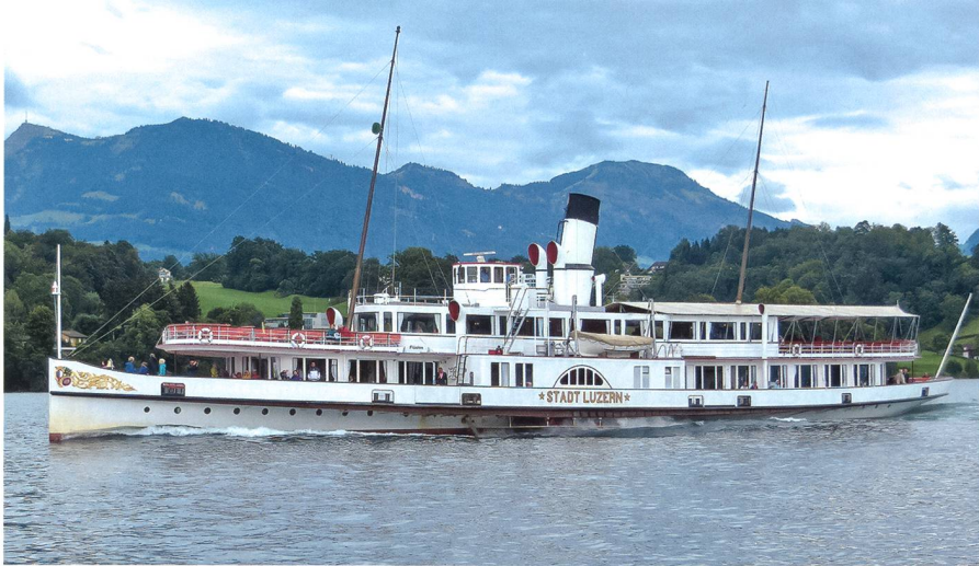
DS «Stadt Luzern»

des Plateaus von Gempfen war der Anschluss an die ebenfalls lineare französische Verteidigung vorgesehen.