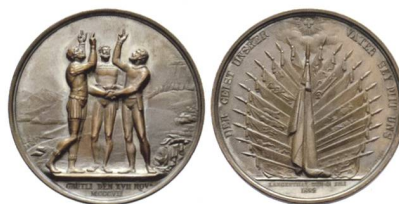
Medaille Offiziersfest Langenthal 1822.

Guisans Armee war 1939 nicht sehr mobil, es galt, sich einzugraben oder nach Hause zu gehen. Allein, die Generation von 1939 bis 1945 sagte insgesamt Nein zur Herrschaft des Antichrist (Karl Barth). Widerstand ja, aber wie? Guisan hatte ein klares Konzept: Kampf ab Grenze, den Feind abnutzen und ihn dann auf die stark ausgebaute Hauptkampflinie Sargans-Zürich-Villigen-Plateau von Gempfen (Armeestellung) auflaufen lassen. Im Raum