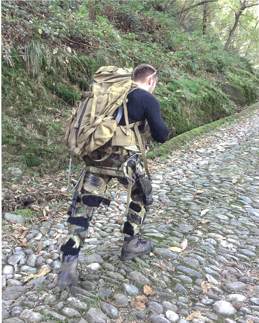
Testmarsch mit Exoskelett und Last.

Während der DEFTECH-Konferenz vom 3. Juni 2014, bei der es um Exoskelette ging, habe ich armasuisse W+T angesprochen, um zu fragen, ob sie nicht