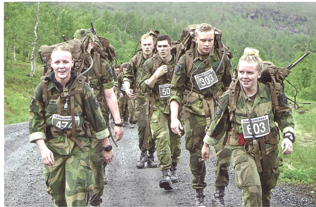
«Auf, auf, marsch, marsch.» Ein 30-km-Marsch (ohne Schiessen) mit Rucksack und Sturmgewehr (zusammen 11 kg) um das renommierte «March Merit Badge».