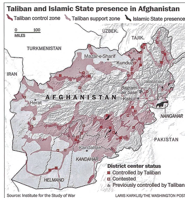
Gebiete unter Kontrolle (rot) oder Einfluss (rötlich) der Taliban.

In einem Bericht des Aufsichtsgremiums des US-Senats für die Hilfe in Afghanistan (Sigar) ging jüngst hervor, dass die Regierung Ende Mai nur noch 65,6 Prozent der 407 Bezirke des Landes kontrollierte. Ende Januar seien es noch 70,5 Prozent gewesen.