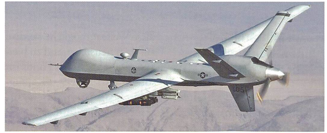
MQ-9 Reaper «Sensenmann» Drohne.

Die Richtlinie ist 18 Seiten lang und in acht Abschnitten gegliedert: Abschnitt 1 beschreibt den grundlegenden regierungsinternen Ablauf, nach dem Pläne zur direkten Bekämpfung terroristischer Ziele erstellt werden. Abschnitt 2 beschreibt die speziellen Voraussetzungen für die Entführung und «langfristige Erledigung» von Terroristen. Abschnitt 3 widmet sich