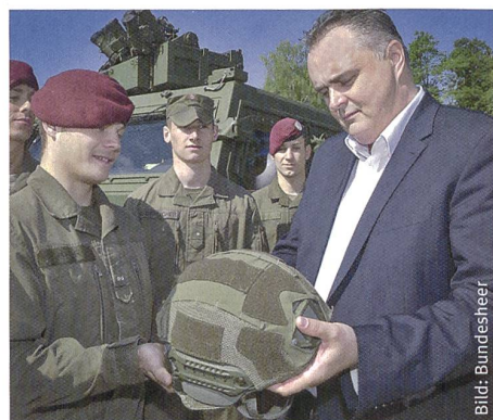
Doskozil präsentiert den neuen Helm.

eines «Lebensarbeitszeitmodells» will man Fachwissen und Loyalität bis hin zur Pension sicherstellen. Die (Grund-)Ausbildung wird ebenfalls regionalisiert, die Logistik- und Infrastrukturbewirtschaftung dezentralisiert und zusätzlich zu den territorialen und militärbehördlichen Aufgaben der Bundesländer werden auch Einsatzführungsaufgaben an die Länder abgegeben. Die zusätzliche Stärkung der Miliz soll bereits bis 2018 durch Bildung von zwölf Kompanien begonnen und ab dann noch intensiviert werden. Bereits jetzt wurden 20000 neue Helme bestellt, Ersatz für den Puch-G und Pinzgauer beschafft, die Black-Hawk-Flotte vor dem Sparzwang gerettet, neue Transporthelikopter angekündigt sowie die Herkules Flugzeuge upgedatet.