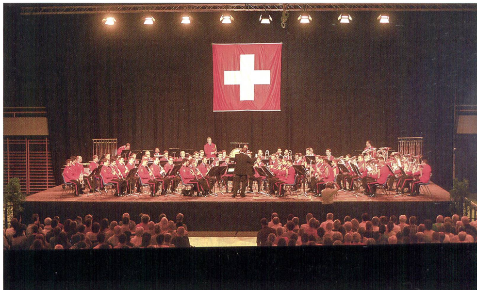
Swiss Army Central Band.

auswärtige Angelegenheiten (EDA) und des Chefs der Armee, Korpskommandant André Blattmann, hat eine Kleinformation der Schweizer Militärmusik die 1.-August-Festlichkeiten der Botschaften in Seoul (Südkorea), Peking