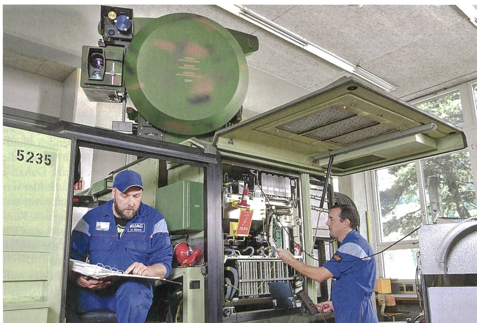
Hochspannungsmessung im Radarsender vom Skyguard des MFlab-Systems.

Der RUAG-Standort Zweisimmen beschäftigt 84 Mitarbeitende und bietet eine breite Palette an Lehrplätzen. Zur Zeit bildet Zweisimmen 15 Lernende in verschiedenen Berufen aus: Automatiker, Elektroniker, Polymechaniker, Logistiker und einen Fachmann Betriebsunterhalt. Die Berufsbildung ist eine wesentliche Grundlage für die zukünftige Entwicklung des Standortes. zvq