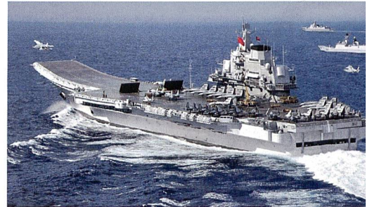
Flugzeugträger Liaoning.

Natürlich schauen auch westliche Länder, allen voran die USA, mit zunehmendem Misstrauen ins Südchinesische Meer. Die Amerikaner, wie auch Europäer, sehen ihre wirtschaftlichen Interessen mehr