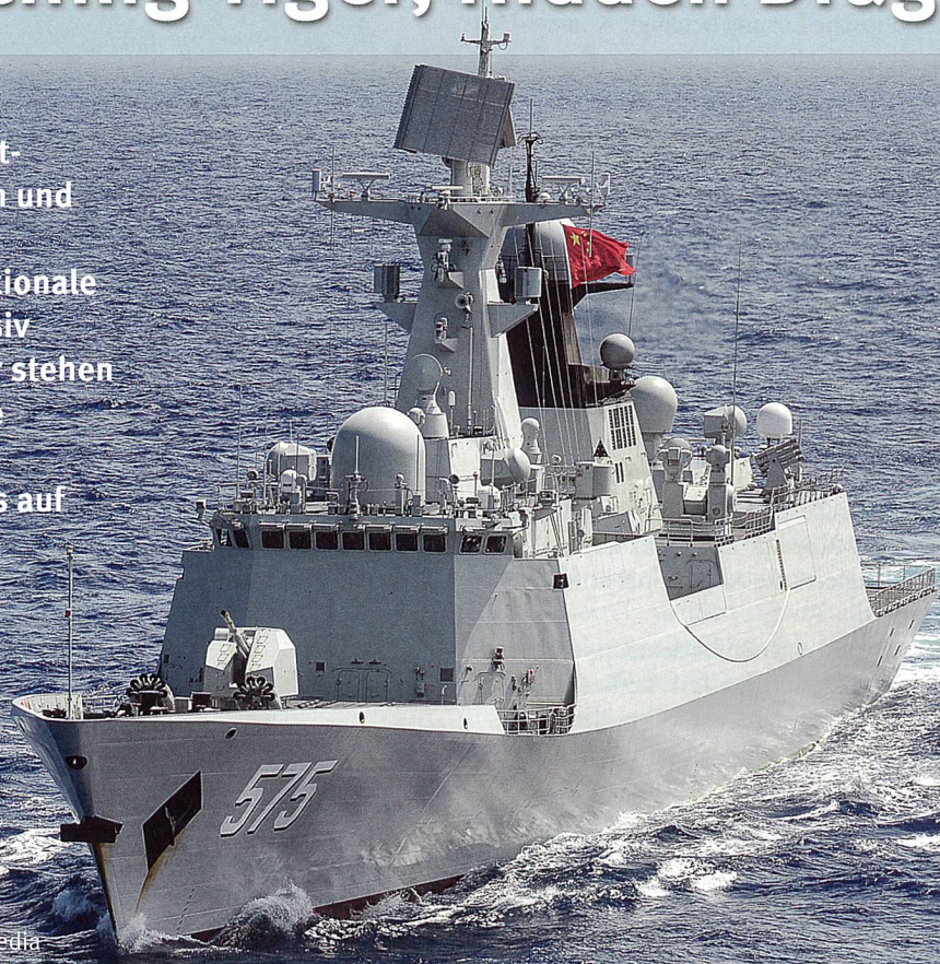
Fregatte des Typs 054A (Jiangkai II-class), 20 Schiffe im Betrieb, 4 im Bau.

China wechselt zwischen selbstbewussten Stärkebekundungen und Beschwichtigung hin und her: Auf der einen Seite wird die nationale Verteidigungspolitik als defensiv beschrieben, andererseits aber stehen Grossmachtambitionen und die Wiederherstellung des ganzen chinesischen Interessenraumes auf der Agenda.