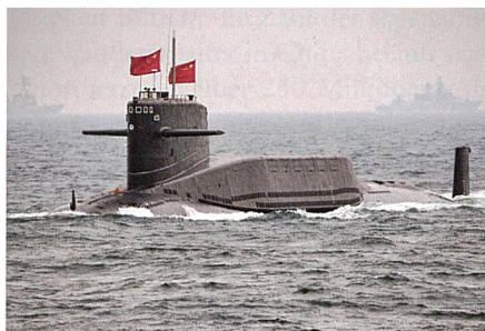
U-Boot der Jin-Klasse.

men (Aden) durch die People Liberation Army Navy (PLAN) evakuiert 21 . Diese Auftritte dienen China in zweierlei Hinsicht. Erstens wird der Weltöffentlichkeit die eigene «Blue Water» 22 -Kapazität vor Augen geführt und zweitens sammelt die PLAN wertvolle Erfahrungen in der internationalen Zusammenarbeit und für die eigene, sich in der Entwicklung befind-