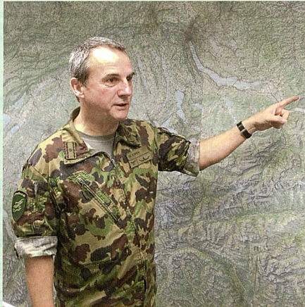
Brigadier Werner Epper, Chef Luftwaffenstab.

Aus Ressourcengründen haben wir uns in den vergangenen Jahren auf die Optimierung des Einsatzführungsprozesses konzentriert. Die Volltruppenübung STABANTE 15 hat mit der Unterstellung eines artfremden Bataillons des Heeres schliesslich zur Erkenntnis geführt, dass der Kommandoführungsprozess optimiert werden muss. Anders ausgedrückt: Insbesondere in JOINT-Operationen ist eine klare und einheitliche Kommandoführung essentiell. Deshalb wurde während des diesjährigen WEFs diese und damit auch das Battle Wheel im Einsatzverband Luft (EVL) konsequent gemäss der Führungs- und Stabsorganisation (FSO) gelebt. Dadurch wurde der Führungsrhythmus gegenüber früheren Jahren deutlich optimiert und komplettiert. Die Prozesse und insbesondere der Informationsfluss zu den anderen Einsatzverbänden konnten effizienter und durchgängiger gestaltet werden. Kernelement bildete das Lageverfolgungszentrum (LVZ), welches während des Einsatzes aufgebaut und laufend verbessert wurde. Das LVZ leistete dank der Erfahrung der Milizoffiziere schon nach kurzer Zeit einen wertvollen Beitrag zur Beschleunigung des Informationsflusses in alle Richtungen. Es war eingebettet in einen Kernstab mit Funktio-