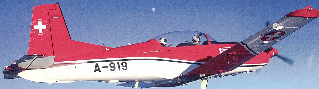
SIMBA 9 unterwegs: In wenigen Minuten ist die Crew der PC-7 «on station».

Erstmals reichte die Sperrzone LS-R 90 über dem Kongressstandort Davos am diesjährigen World Economic Forum auch im Engadin bis zum Grund. Während für die zivilen Piloten die fliegerischen Prozesse durch diese Anpassung etwas vereinfacht werden konnten, bedeutete es für die Controller der Bewegung und Koordination (BEWEKO) in der Einsatzzentrale Luftverteidigung (EZ LUV) in Dübendorf hingegen tendenziell mehr Arbeit als bisher.