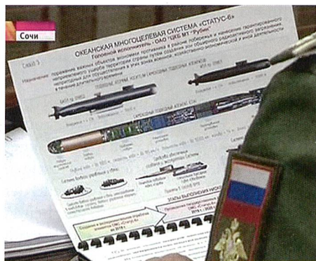
Projekt STATUS-6, absichtlich den Medien präsentiert?

Um auf internationalem Niveau Schritt halten zu können, beabsichtigt Russland bis ins Jahr 2020, für geschätzte 9 Mia. US Dollar seine Drohnenflotte aufzurüsten. Um den zukünftigen Anforderungen des Gefechtsfeldes, insbesondere den ISR-Bedürfnissen gerecht zu werden, sollen die derzeit zumeist aus israelischer Produktion stammenden 500 unbemannten Flugzeuge durch neue, in russischer Eigenfertigung gebaute Systeme ergänzt werden. Das Bedürfnis entspringt nicht alleine den