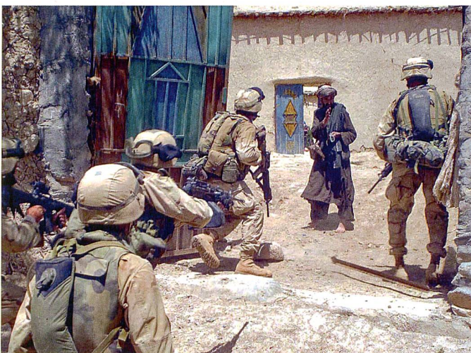
US Marines im zivilen Umfeld?

Als Teil ihrer Strategie für zukünftige internationale Einsätze müssen sich die US-Streitkräfte deshalb eine Doktrin bezüglich der Interaktion von Militäreinsatz und Rule of Law geben. Es wird dabei differenziert zwischen labilen Staaten, untergegangenen Staaten, und de-facto aufgelöster Staatsgewalt. Darüber hinaus sind die Interaktionen mit internationalen Organisationen, multinationalen Einsatzkräften und nichtstaatlichen Akteuren zu berücksichtigen. Das entsprechende Arbeitspapier des JCS wird im Frühjahr 2016 erwartet.