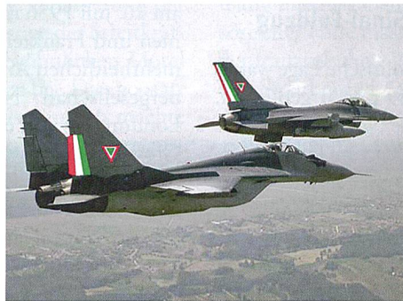
Ja es gibt sie, die mexikanische Luftwaffe.

In Anbetracht der Grösse des Landes nehmen die mexikanischen Luftstreitkräfte eher