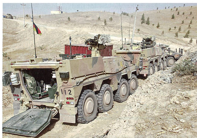
GTK BOXER im Afghanistan-Einsatz.

entspricht dann eher einem längeren Praktikum, schliesst Bartels. Noch interessanter dürfte aber die per 2016 neu eingeführte Arbeitszeitverordnung für Soldaten sein. Dazu der stellvertretende Inspekteur der deutschen Marine, Konteradmiral Brinkmann: «die 41-Stunden-Woche dreht das Grundverständnis des soldatischen Dienens auf links». Damit nach den jüngsten Ereignissen in Europa auch die deutsche Terrorabwehr verstärkt wird, stellte Mitte Dezember 2015 Innenminister de Maizière eine nach militärischen Standards mit Langwaffen und gepanzerten Fahrzeugen ausgerüstete «Beweisicherungs- und Festnahmeinheit plus» (BFE+) genannte Bundespolizeieinheit auf. Dafür sind 250 Stellen vorgesehen, wovon 50 Polizisten (als ein Team) unmittelbar eingesetzt und 4 weitere Teams im Verlauf des Jahres aufgebaut