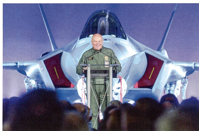
Chef der Luftwaffe, Generalleutnant Preziosa bei der Übergabe des ersten F-35.

Nach den Anschlägen in Paris möchte auch Italien sein Sicherheitsetat anpassen. Von der durch Premier Matteo Renzi versprochenen Aufstockung sollen 500 Mio. an die Armee gehen, 150 Mio. im Bereich Cyber aufgewendet werden und zusätzlich 350 Mio. der konsequent unterfinanzierten Polizei zukommen. Diese «Sicherheitsmilliarde» wird mit einer zusätzlichen «Kulturmilliarde» ergänzt, welche beispielsweise Theatergutscheine für Jugendliche vorsieht. Soweit Renzis Plan. Bisher wurden aber insbesondere bei der Armee noch keine Zahlungen bemerkt, denn das Geld war bis Ende 2015 noch nicht freigegeben. Derzeit erwarten di-