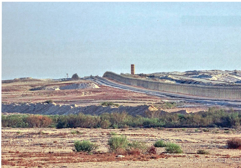
Israelisch-ägyptische Grenze bei Nizzana/ Israel.

In den Jahren nach dem Unabhängigkeitskrieg 1948/49 waren die israelischen Streitkräfte zu einer professionellen Armee ausgebaut worden. Den Kern bildete eine zahlenmässig kleine Gruppe von Berufssoldaten (1956 ca. 11 000 Mann), die die Leitung, Planung, Organisation und Ausbildung der Streitkräfte übernahmen sowie die Mehrheit in den technisch anspruchsvolleren Waffengattungen Luftwaffe und Marine stellten. Die Wehrpflichtigen machten etwa 30 Prozent der verfügbaren