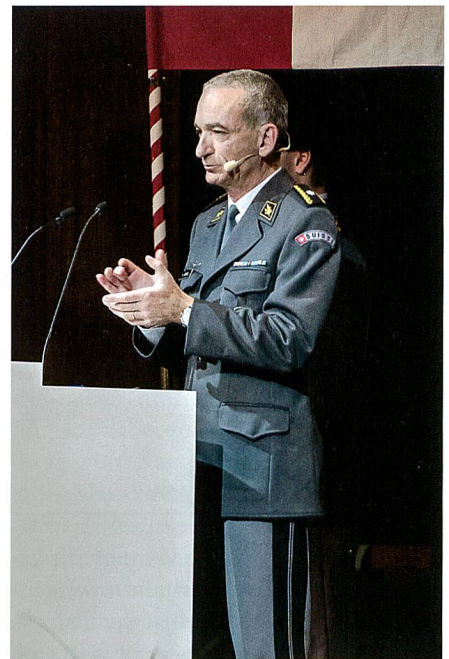
Brigadier Langel hält Rückblick und Auschau.

on der Ausbildung. Es werde kompetent, verantwortungsbewusst und gewissenhaft geführt.