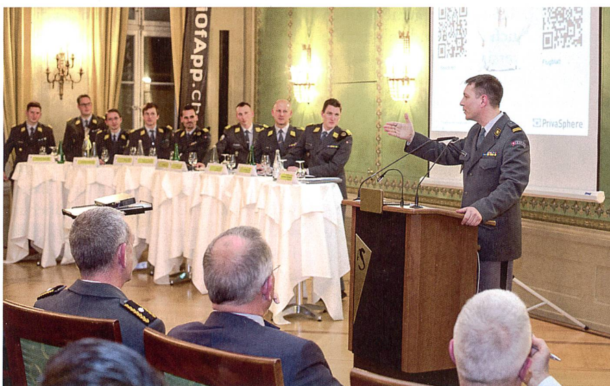
Der initiative Vorstand der OG Panzer mit seinem Präsidenten.