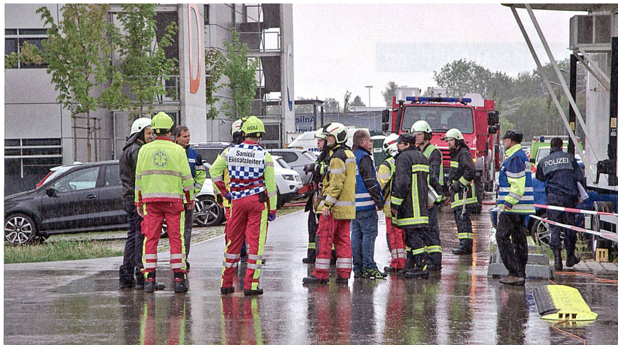
Blaulichtorganisationen im Einsatz mit der Betriebsfeuerwehr.

Unterdessen übernahm die Polizei auf dem Schadenplatz den Lead und sperrte diesen weiträumig ab. Die von der Feuerwehr geborgenen Verletzten wurden durch den Rettungsdienst in Zusammenarbeit mit der Betriebs-sanität versorgt. Schliesslich gelang es der Betriebsfeuer-