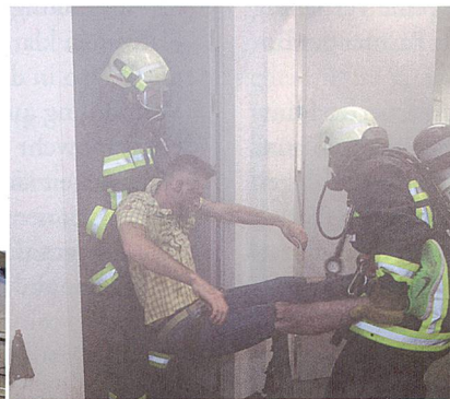
Bergung der Verletzten durch den Rettungstrupp der Betriebsfeuerwehr.

Die Übergabe von Frühschicht zu Spätschicht des SDO wird unsanft unterbrochen.