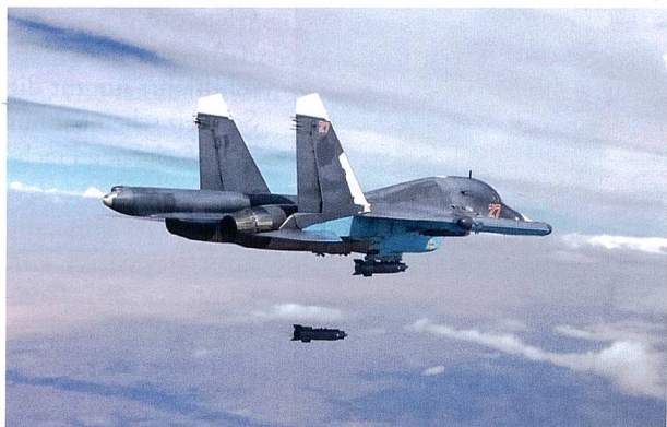
Eine russische Su-34 beim Abwurf einer KAB-500S-Präzisionsbombe am 9. Oktober 2015 während des Einsatzes in Syrien.

Dank der Umsetzung des Aufrüstungsprogramms und der leistungsfähigen Rüstungsindustrie kann Russland auch an zwei geopolitisch sehr unterschiedlichen Orten gleichzeitig Krieg führen. In und über Syrien testete die russische Führung bis anhin ihre Luftstreitkräfte (Luftraumstreitkräfte) aus, indem die Erdkampfflugzeuge Su-25 und Jagdbomber Su-24 und Su-34 sowie Mittelstreckenbomber Tu-22M über die syrische Opposition Bombenteppiche von Freifall-Splitterbomben hoher Explosivwirkung abwarfen. Hin und wieder wurden durch strategische Bomber Tu-95 und Tu-160 luftgestützte Marschflugkörper (Kh-55/SM und Kh-102) und seegestützte Marschflugkörper Kalibr gegen Ziele in Syrien eingesetzt. Den Nachschub für die russischen Kampfflugzeuge in Syrien leisteten Transportflugzeuge An-124 oder Il-76 oder/und Transportschiffe über den Bosphorus zum russischen Hafen Tartus in Syrien.