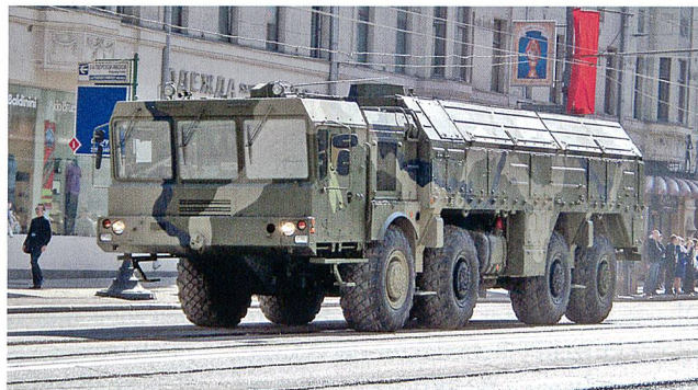
Iskander Rakete auf Trägerfahrzeug MZKT 7930.

te 2016 gar der Ernstfall eintreten, dann ist aufgrund der bisherigen Erfahrungen mit Obama im Krieg in Syrien vorstellbar, dass er eine russische Aggression nur zögernd mit militärischen Mitteln abwehren und deshalb die Unterstützung der USA für die Europäer mit Verspätung eintreffen würde.