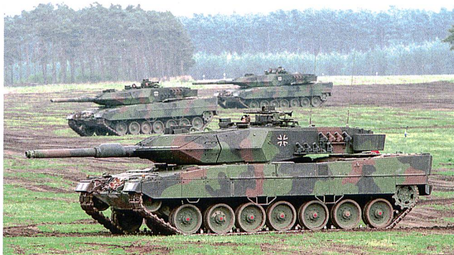
Leopard 2A5 der Bundeswehr.