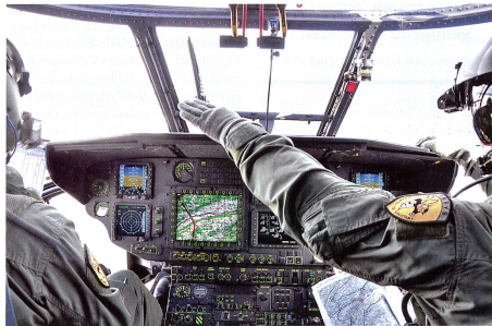
Bei allen Trainingsflügen wurde der Radarschatten gesucht und genutzt.

Trotz elektronischer Hilfsmittel wird im Cockpit mit Karten navigiert.