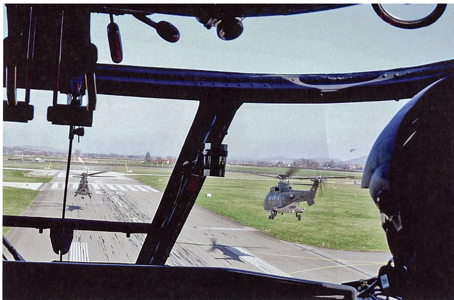
Schon der Start auf dem Flugplatz erfolgte in Formation.

Bei diesen Übungsmissionen wird statt der scharfen Chaffs und Flares Übungsmunition eingesetzt. Ausgestossen wird daher während dieser Flüge nichts, jedoch können die Piloten nach dem Einsatz den Verbrauch kontrollieren und mit den Angaben des Systems vergleichen.