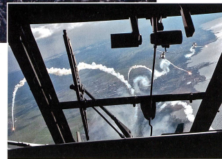
Das taktische Fliegen war immer gefordert, auch beim «scharfen» Schuss in Formation über dem Neuenburger See.

Das ISSYS beinhaltet folgende Komponenten: Warneinheiten gegen Raketenbeschuss sowie Laser- und Radarbestrahlung (Missile Approach Warner, Laser