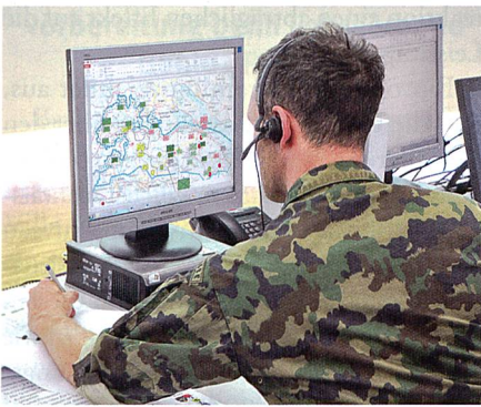
Stabsoffizier bei der Arbeit mit FIS HE.

Mit Umsetzung der Weiterentwicklung der Armee (WEA) ab 01.01.2018 geht es für die HKA nun darum, das FIS HE künftig in sämtlichen Milizlehrgängen einzusetzen. Dies stellt insbesondere für die ZS eine nicht zu unterschätzende Herausforderung dar. Folgend sollen der aktuelle Bearbeitungsstand des Ausbildungskonzeptes, spezifische Fragestellung und weitere Erkenntnisse, auch in Bezug auf die spätere Tätigkeit in den Einteilungsverbänden, aufgezeigt werden.